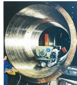
Schleifen der Oberfläche eines schweisssplattierten Schusses für die Ultraschallprüfung.