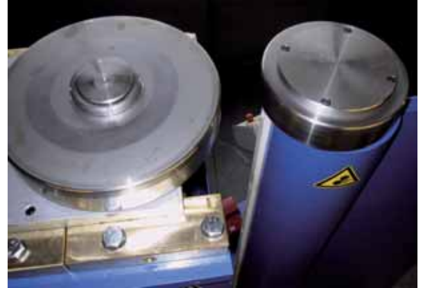
Angebauter Band- und Rotorschleifkopf zum Schleifen und Bürsten der Schweissnaht

Attached belt or wheel grinding head for grinding and brushing of the seam