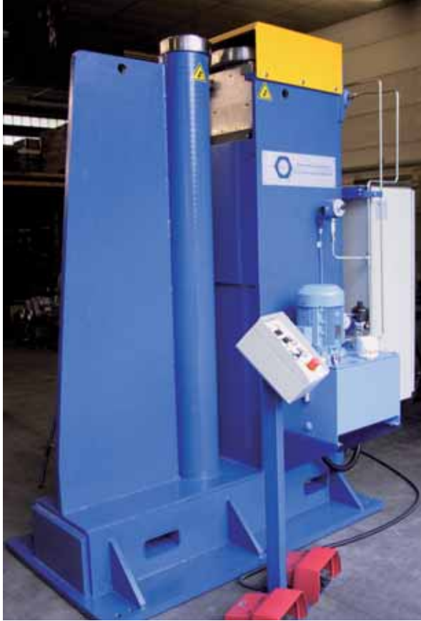
Zum Glätten von stumpf geschweissten Zargen